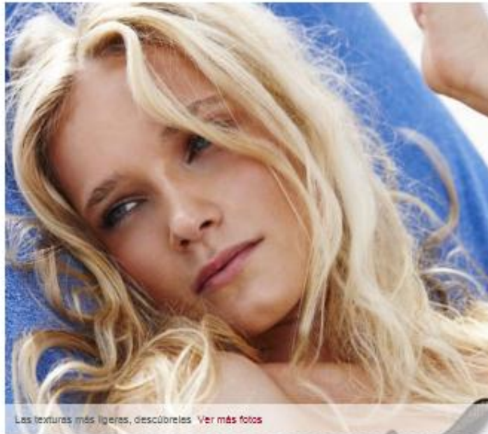
Las texturas más ligeras, descúbrelas. Ver más fotos

Más de 20 cremas de textura hiper ligera para evitar la sensación pesada en el rostro