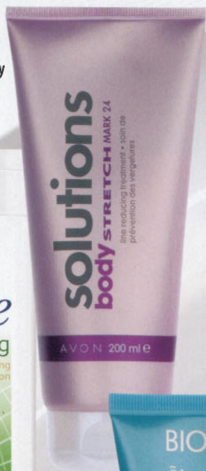
Terhességi csíkok elleni krém, AVON Solutions Body Stretch Mark 24, 1099 Ft