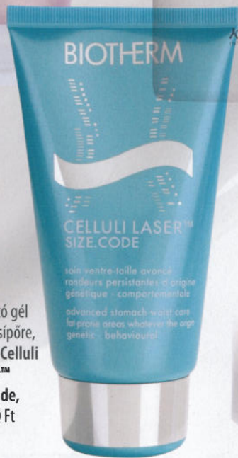
Karcsúsító gél hasra és csípőre, Biotherm Celluli Laser™ Size.Code, 12 400 Ft