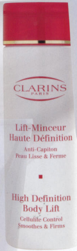
Cellulitiz- megelőző, feszítő testápoló, Clarins High Definition Body Lift, 11 990 Ft