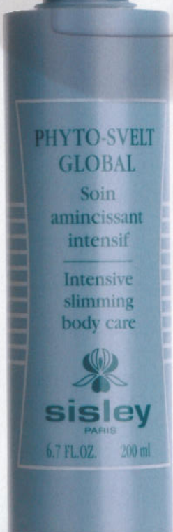
Karcsúsító testápoló, Sisley Phyto-Svelt Global, 45 990 Ft

Az igények egyre magasabbak, ezért már minden olyan testrészünkre találhatunk feszesítő hatású gél, testápolót, amely problémás lehet. Sokan a bokájukat és a vádlijukat szeretnék karcsúsítani, mások a csípőjükről tüntetnék el a felesleget. A hason lévő makacs zsírpárnáknak is van már ellensége – ha a hasizomgyakorlatok mellett hasfeszítő krémet is használunk, sokkal gyorsabban érhetjük el a kívánt eredményt.