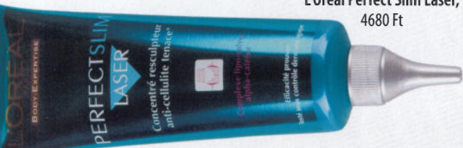
Testfeszítő krém, L'Oréal Perfect Slim Laser, 4680 Ft