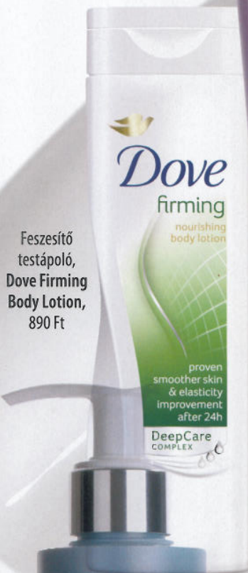
Feszítő testápoló, Dove Firming Body Lotion, 890 Ft